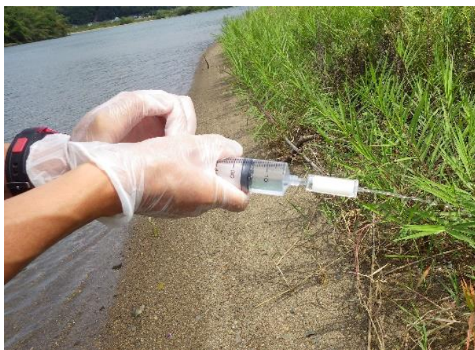
図1. 採水した河川水をろ過している様子。注射筒の先についている白い物が、フィルターの入ったカートリッジ。