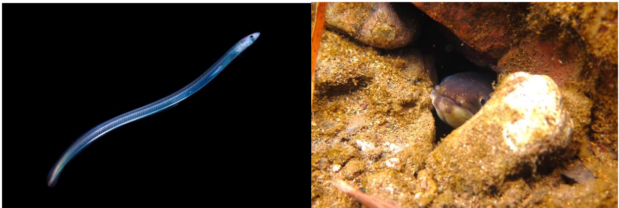
(左) シラスウナギ，(右) 河川に生息するニホンウナギ

なお，本研究成果は，2021 年 2 月 25 日（木）公開の Frontiers in Ecology and Evolution 誌にオンライン掲載されました。