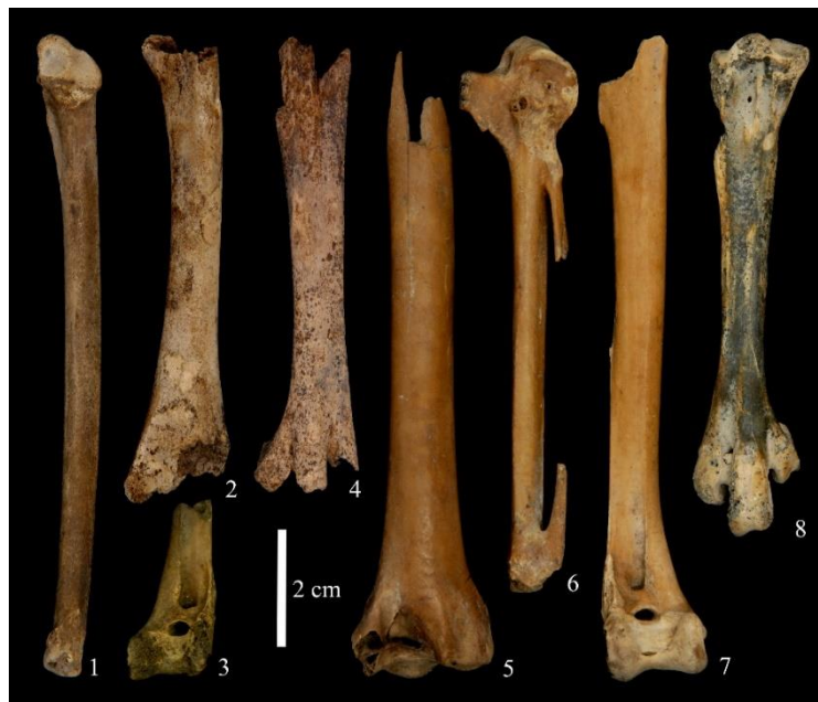
図 1. 田螺山遺跡で確認されたガン類の幼鳥（1-4）と在地性の成鳥（5-8）の骨