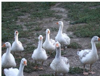
現代のシナガチョウ（左）とヨーロッパガチョウ（右）