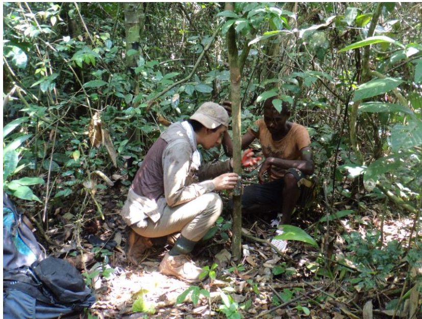
地域住民と協力してカメラトラップを設置する様子。