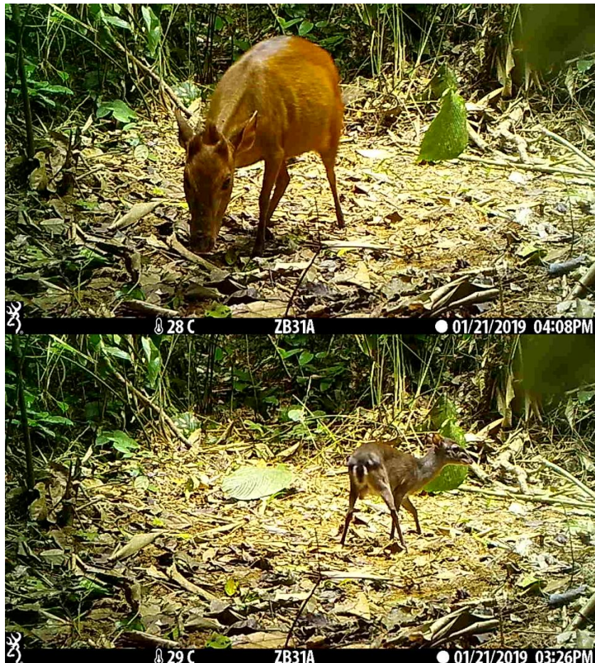
カメラトラップで撮影されたピータースダイカー（レッドダイカー類）（上）とブルーダイカー（下）。