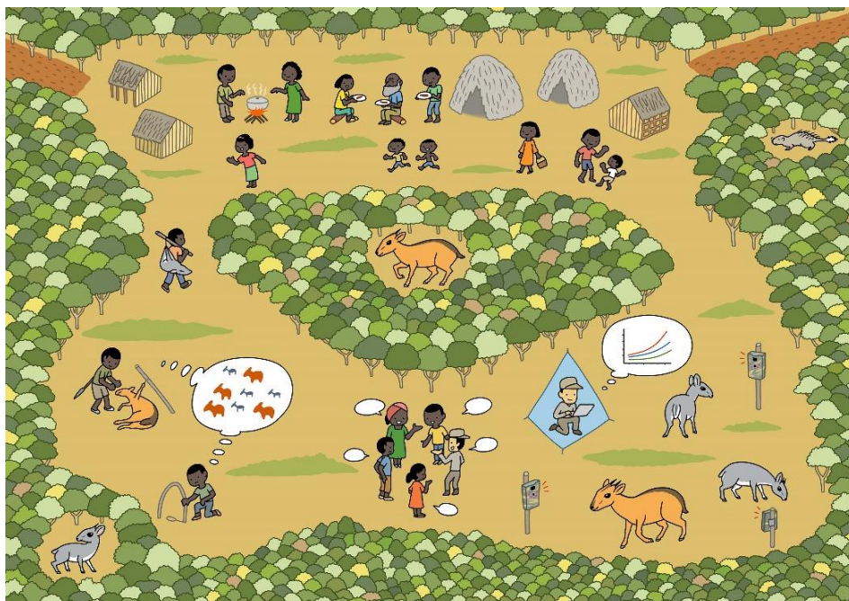
本研究のイメージ図（イラスト：いずもり・よう）

本成果は、2022年8月26日（現地時刻）に英国の国際学術誌 Journal of Applied Ecology に掲載されました。